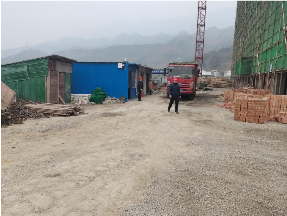
区内施工场地现状