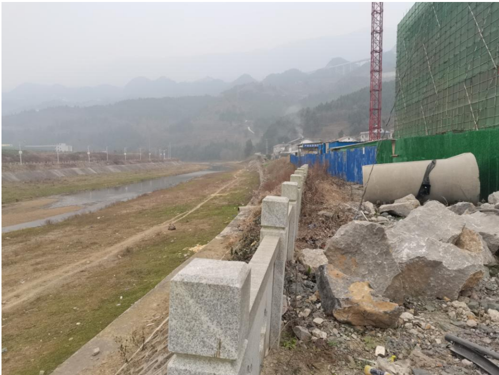
工程区外侧河流现状