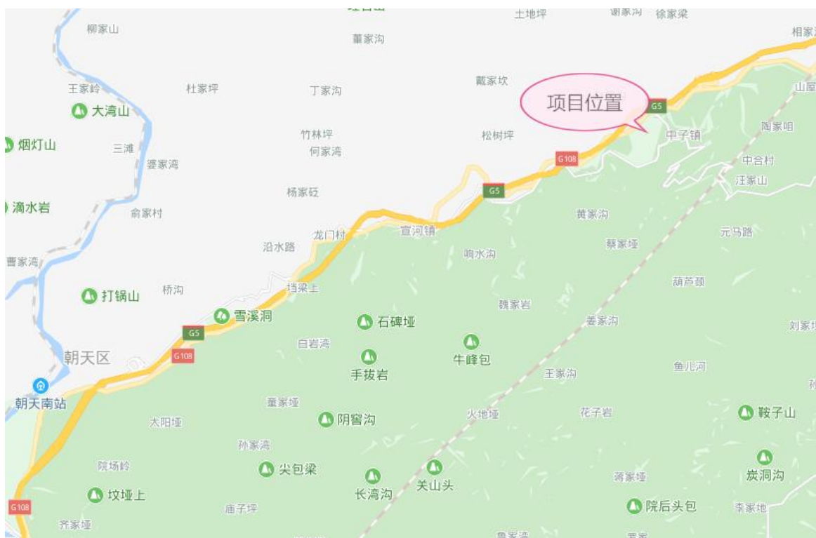
图 1-1 项目区地理位置图

广元市朝天区东西部协作共建产业园标准化厂房生活服务配套设施（创新创业孵化器）建设项目位于广元市朝天区中子镇中子铺社区，朝天区七盘关农产品加工园九道梁食品工业厂房东侧，潜溪河南侧。中心地理位置坐标：东经 106^{\circ} 1' 6.62'' ，北纬 32^{\circ} 41' 17.67'' 。北、西紧靠京昆高速，东临中子镇，南侧为曾家山旅游景区，距朝天区约 20 公里，周边已有西成高铁和京昆高速，七盘关至曾家山快速通道已建成，交通便利，周边风景优美，自然环境资源丰富。