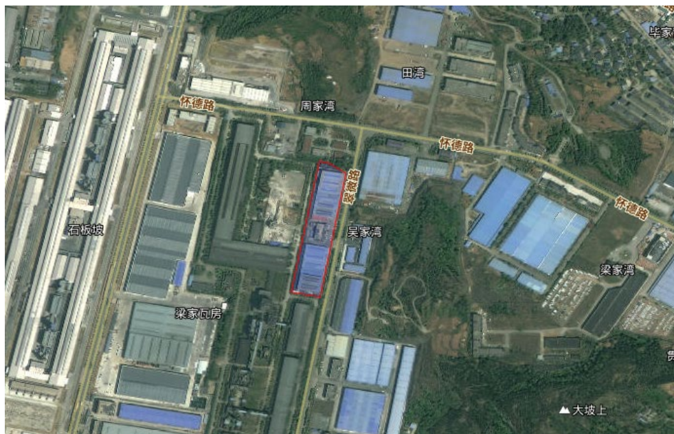
图 2.1-1 项目地理位置图

(3) 建设地点：四川省广元市利州区袁家坝街道翠微路2号，广元经济技术开发区袁家坝工业园。地块位于怀德路南侧，翠微路西侧，南侧为广元市强兴模具氮化有限公司；工程区有滨江路、怀德路、万贯路、翠微路、长兴路等市政道路，周边有G5、G108、滨江西路等，对外交通便利。场地中心地理坐标为105°46'17.19"E，32°24'0.37"N，场地距市中心约7.7km，距广元火车站7.2km。