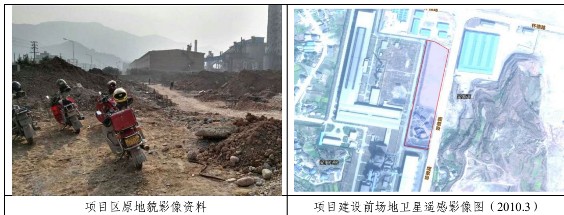
图 2.7-1 项目区现状地表照片及遥感卫星图

场地地处嘉陵江右侧，属一级冲洪积地貌类型。场地地形开阔，坡度平缓，原状分为两个台地，以荒地为主，地表无植被覆盖，存在大量回填土。实测地面钻孔高程 473.30~486.94m，相对高差 13.64m。