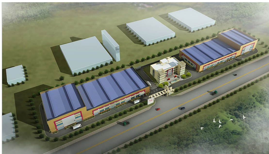
图 2.1-2 建筑鸟瞰图