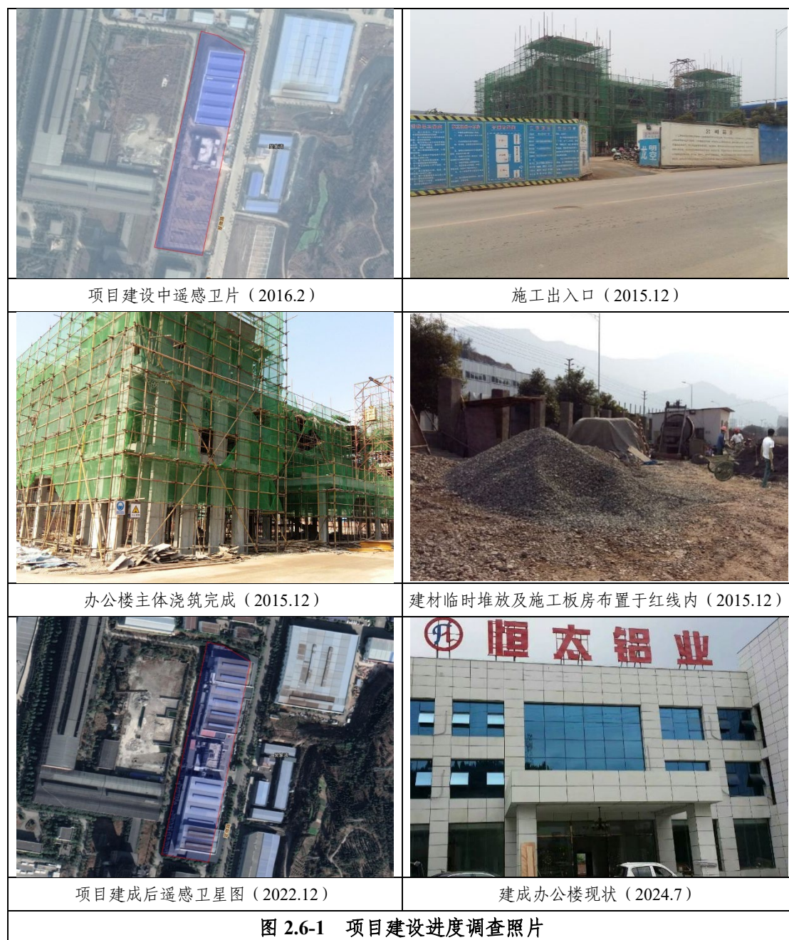
图 2.6-1 项目建设进度调查照片