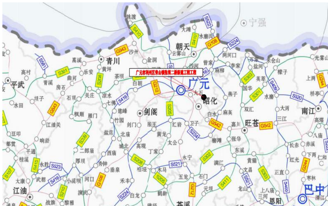
图 2.1-1 项目所在地地理位置示意图

广元市利州区荣山镇张坝二桥新建工程位于广元市利州区荣山镇张坝，桥梁跨越李家河，项目路线起点位于利州区荣山镇张坝社区现状桥梁右岸与村道平交口处，跨越双河后，右转上坡，止于现状平交口。项目起点桩号为 K0+000，终点桩号 K0+124.77，线路全长 124.77m，其中桥梁全长 68m（桩号为 K0+016.5 ~ K0+084.5），桥梁中心桩号：K0+050.0，桥梁中心地理坐标为东经 105°58'57.09"，北纬 32°23'4.62"。