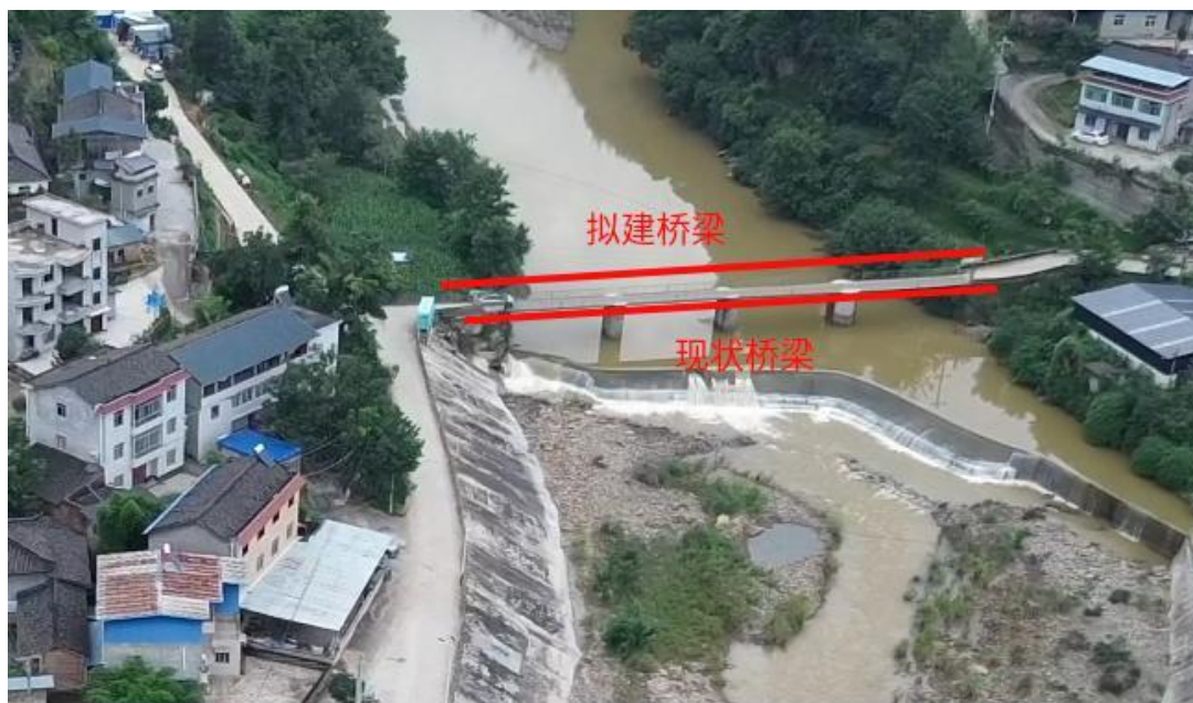
拟建桥址现状、项目方案示意图