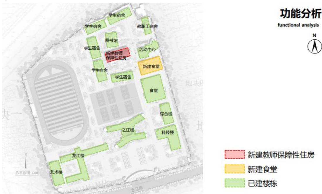
图 2.1-2 平面布置图