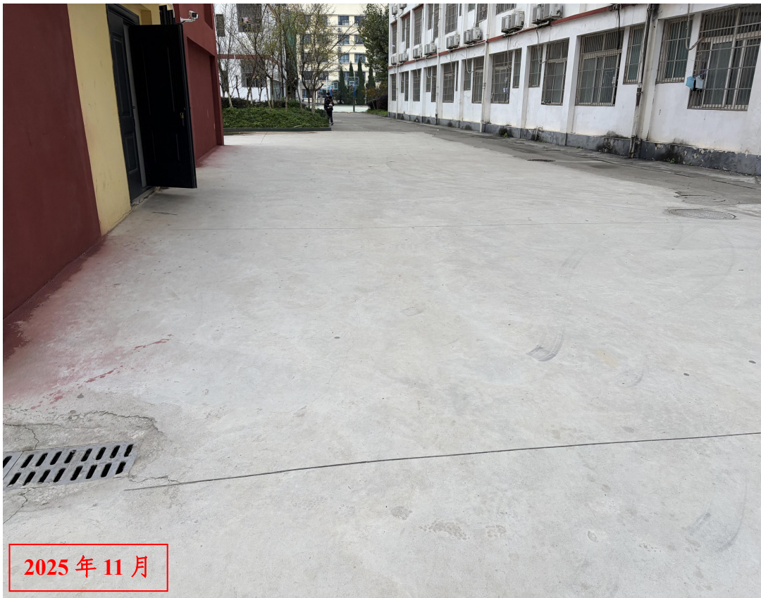
排水工程现场照片