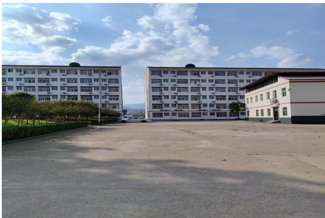
图 2.4-1 进场前原地貌现场照片

根据查阅施工资料及现场实地调查，本项目占地类型主要为公共管理与公共服务用地，对现校址空闲地块新建 1 栋教师保障性住房并完善其附属设施工程等，建设区域为混凝土地面，场地内无可剥表土的条件，因此施工期间不涉及表土剥离。