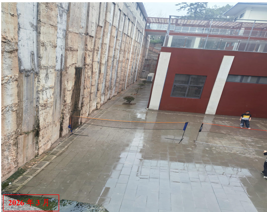
道路工程现场照片