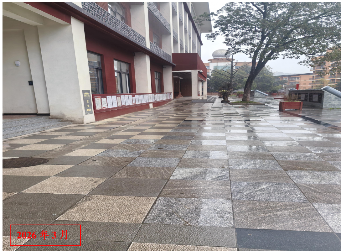
项目建筑物现状照片