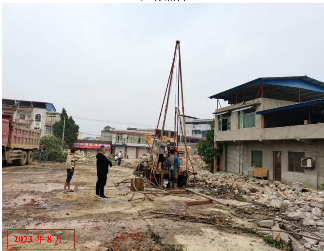
项目施工现场照片