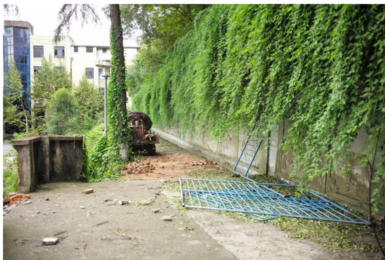
图 2.4-1 进场前原地貌现场照片

根据查阅施工资料及现场实地调查，本项目占地类型主要为公共管理与公共服务用地，对现校址空闲地块新建 1 栋教学楼并完善其附属设施工程等，建设区域为硬化地面，场地内无可剥表土的条件，因此施工期间不涉及表土剥离。